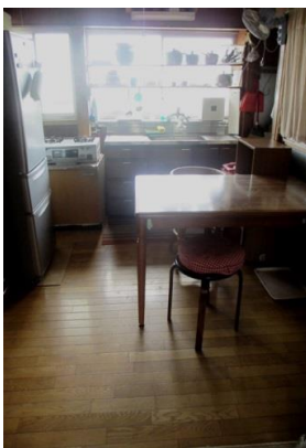
ダイニングキッチン