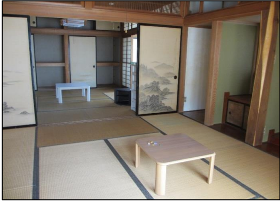
2階 和室 (8帖2室)