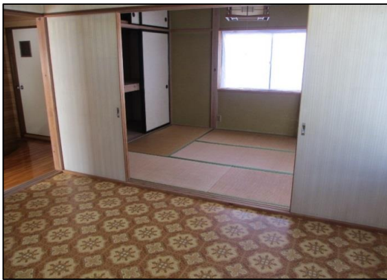
3階 洋室(8帖)・和室 (6帖)